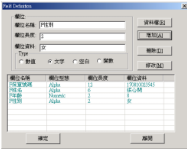
PS Draw 可定義資料欄位。